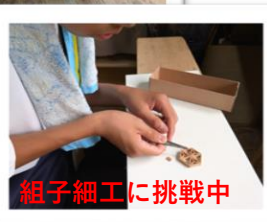
組子細工に挑戦中